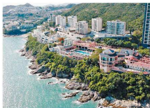
南區坐山面海，擁有極佳風水格局，居住環境極為優美。

香港豪宅遍佈港、九、新界，但說到地位超然的傳統豪宅區，山頂及南區稱兩大代表。整個南區自成一國，三面環海，又有連綿山脈，綠樹成蔭，整體早經風聚氣局，無論走到那裏，都仿如觀賞名畫一樣，居住環境極為優美。