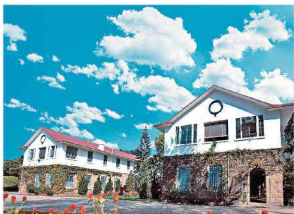
區內最著名的傳統名校首領聖士提反書院。

此外，赤柱向來亦是眾多跨國企業高管首居首選，因而區內學府亦有多間著重多元文化、擁有多首屈一指的國際學校，包括新加坡國際學校、加拿大國際學校、香港國際學校及蒙特梭利國際學校等，當中更有不少校舍注重學術能力，協助學童加強外語能力和拓展國際視野，區內可說是著名的「狀元搖籃」。