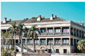
充滿歐陸風格的美利樓是赤柱知名的歷史建築。

位於本港南區的赤柱相若，坐落於港島海岸線上，同時，區內歷史建築林立，包括赤柱地標美利樓、卜公碼頭、赤柱八間屋、舊赤柱警署等。多個歷史建築結構巧妙地融入周遭環境，建構出如地中海沿岸歐陸小島，充滿著希臘、意大利與法國等地的超級富豪度假勝地氛圍，是本港急促的生活中難得一見的世外桃源，因此吸引不少不同規模的頂級洋房及豪宅進駐，屬於令人嚮往的理想居住地。