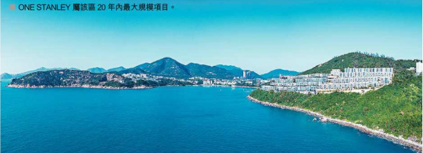
ONE STANLEY 屬該區 20 年內最大規模項目。