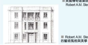
美國傳奇建築師 Robert A.M. Stern

建邨地產集團銳意將項目打造成區內超級地標，特意重金禮聘多名世界各地享負盛名的設計團隊，包括曾主理山頂亞洲樓 Mount Nicholson 及 St. Georges Mansions 等本港頂級地標性豪宅項目的美國傳奇建築師 Robert A.M. Stern。今次 ONE STANLEY，揉合了臨海優越地段、殿堂