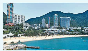
赤柱超級豪宅供應有限，每每推高區內樓價。

由於赤柱超級豪宅供應有限，加上大部分業主惜售單位，區內一盤難求，變相推高區內入場門檻，而近年區內亦不乏高價成交，包括NO. 50 STANLEY VILLAGE ROAD 洋房15，以1.65億元售出，面積2,741呎，呎價高達60,197元。