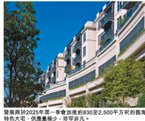
發展商於 2025 年第一季會加推約 830 至 2,500 平方呎的臨海特色大宅，供應量極少，珍罕非凡。

另外，為迎合不同買家需要，發展商亦推出約 1,100 至 2,500 平方呎的臨海特色大宅，當中包括 3 房 1 套花園大宅、3 房 1 套天際大宅及 5 房 4 套複式大宅，各僅提供 6 伙。每款戶型供應量極少，機會難得，投資潛力可見一斑，打算進軍豪宅市場的買家務必要把握時機入市。