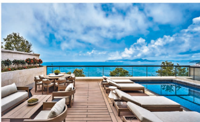
臨海豪宅 ONE STANLEY 位於風光明媚的赤柱，住戶每天也能感受有如峇里島的景致。

另外，項目採用低密度設計，周邊環境清靜、私隱度高，令人仿如置身於奢華的度假小鎮，而赤柱又有異國風情的大街小巷，兼具環境舒適及生活便利的雙重優勢，無論置身 ONE STANLEY 屋苑內外都洋溢著濃厚的外國度假氛圍，將峇里島的獨有魅力於赤柱完美重現。