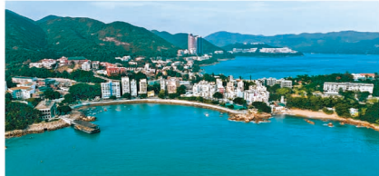
駕車前往ONE STANLEY由喧鬧市中心進入靜謐的世外桃園。

面對忙碌的生活節奏，相信不少人都期望每天回家能短暫忘卻繁忙的都市生活。沿赤柱海灣駕車前往 ONE STANLEY，途中不但可以欣賞風景怡人的海岸線，過程更仿如駛進了隱匿鬧市中的世外桃源，讓住戶能將由繁華紛擾的城市生活拋諸腦後。