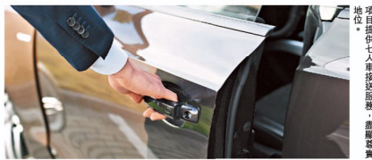
項目提供七人車接送服務，盡顯尊貴。

集優越地理位置、迷人景色、頂級建築設計、消閒生活配套與優質校網於一身，令建灝地產的地標式豪宅 ONE STANLEY 勢必成為買家必爭之選。項目共提供 82 個單位，包括 11 座 4 層高的臨海特色分層住宅及 32 幢豪華海濱獨立洋房。