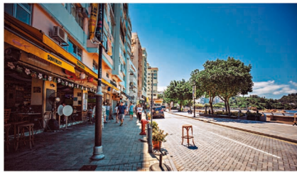
赤柱大街有多間充滿歐陸風情的餐廳及酒吧，可全天候共舉歡樂時光。

無獨有偶，峇里與赤柱同樣是融合傳統文化與異國風情之地，區內既有過百年的歷史文化古蹟，又有風景如畫的海濱小鎮。走在赤柱大街上，多間充滿歐陸風情的餐廳、酒吧及咖啡室，源源不絕送上美酒佳餚。加上琳瑯滿目的市集、商場、超市及特色商舖，美饌、購物、娛樂一應俱全，將峇里的豪華生活空間、臨海美景與悠閒生活一次過帶入這個活力社區。