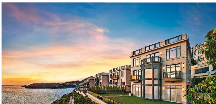
ONE STANLEY項目由50個分層住宅及32間獨立洋房組成，共提供82個單位。

有「天堂之島」美譽的峇里島向來是熱門的度假勝地，其醉人的日落景致、一望無際的遼闊海景、多姿多彩的消閒活動，無論熱愛繁華熱鬧抑或鍾情悠閒恬靜亦能滿足所好。由建灝地產精心打造的臨海超級豪宅項目ONE STANLEY位處擁有「香港後花園」之稱的赤柱，項目不單坐擁絕佳的自然景觀及遼闊的藍天碧海景色，更有頂尖的建築設計及帝王式豪宅配套，讓住客無須長途跋涉也能享受沉浸式的峇里度假生活。