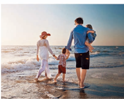
赤柱既有不同的水上活動又有寧靜的海灘，住戶可以隨時與家人親臨天倫。

除了得天獨厚的迷人景致，赤柱之所以能夠吸引城中名人富豪進駐，其媲美峇里島的「不夜天」時尚魅力亦應記一功。鄰近多間頂級私人會所，如香港哥爾夫球會、深灣遊艇會及美國會所等，消閒活動一應俱全，盡顯尊貴身份。