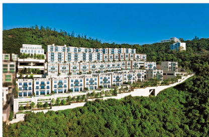
ONE STANLEY 位處赤柱黃麻角道，是近 20 年來區內罕見的超級豪宅項目。

至於獨立洋房則涵蓋 3 房 2 套至 5 房 5 套，實用面積由 2,695 至 7,079 平方呎不等，所有單位均享有遼闊南海海景，並設有私人升降機、前後花園及專屬天台，部分更設有私人泳池，盡享顯赫身份。