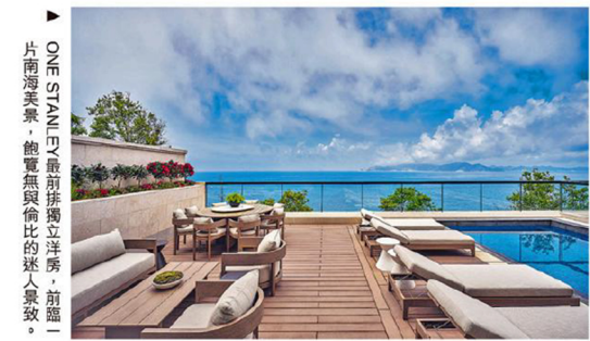
ONE STANLEY 巔峰排屋獨立洋房，前臨一片南海美景，飽覽無與倫比的迷人景致。

大宅內品嚐咖啡，感受海風輕撫；在寬敞客廳內放空冥想，欣賞層層疊疊的山巒與一片蔚藍交織成的自然畫作；在舒適臥室中甦醒，迎接曙光灑落的溫暖。ONE STANLEY 將峇里島的迷人景致收納於你的窗前，讓你足不出戶，就能享受到恍如置身於豪華度假別墅，時刻體驗專屬於你的度假時光。