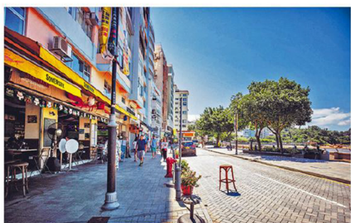
赤柱大街上，人們悠然漫步，餐廳林立，瀟灑著濃厚的異國風情。

在這裏，生活節奏彷彿被刻意放慢。赤柱大街上，古色古香的建築訴說著悠久歷史；海濱長廊旁，各國遊客與本地居民悠然漫步；特色小店與歐陸餐廳林立，為這個海濱小鎮增添了濃厚的異國情調，深受不少外籍人士喜愛。近年，愈來愈多內地名人及富商亦鍾情赤柱的歐陸風情及無與倫比的海景，選擇定居於此。