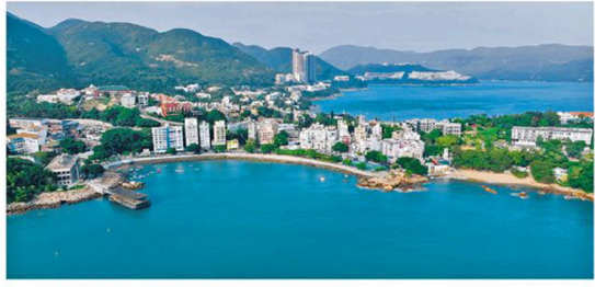
▲ 駕車或享用由項目提供的7人車接送服務，沿着蜿蜒的海岸公路往返市區，飽覽赤柱海灣的醉人風光。