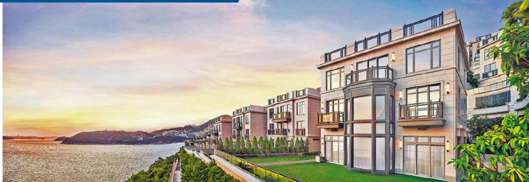
ONE STANLEY 倚倚翠綠山巒，前臨湛藍海洋，把赤柱的自然美景盡收眼底，恍如置身於豪華度假別墅。

住戶無論駕車或享用由項目提供的7人車接送服務，沿着蜿蜒的海岸公路往返市區，都能飽覽赤柱灣的醉人風光，讓每一次往來都化身成為度假式景觀公路之旅。這種遠離塵囂卻又與城市保持聯繫的生活方式，相信正是都市人嚮往的度假式生活模式。